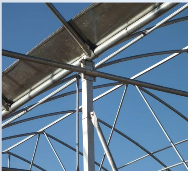
• طرح آرمان

شرکت آرمان کشت آریایی سبز در زمینه طراحی ، مشاوره و ساخت انواع گلخانه ها و شاسی های سبک تولید محصولات کشاورزی و همچنین ارائه خدمات مشاوره ، کشت ، تهیه نهاده ها و تجهیز انواع گلخانه ها و نصب انواع تجهیزات مدرن بر روی گلخانه های مختلف فعالیت می نماید که سابقه فعالیت بیش از ۱۵ سال در برخی از زمینه های ذکر شده را داشته و با تولید و قطعه سازی بسیاری از تجهیزات با کیفیت برتر توانسته در دوره فعالیت خود رضایت مشتریان را جلب نماید . در حال حاضر این شرکت در زمینه تولید صیفی و گل رز شاخه بریده فعالیت می کند و این امر خود باعث می شود که مسئولین شرکت با درک مشکلات گوناگون گلخانه داران محترم همواره سعی و تلاش خود را در جهت بالا بردن کیفیت خدمات ارائه شده به مشتریان نمایند و در جهت بالا بردن کیفیت سازه ها و خدمات خود گام های بزرگی را بردارند .