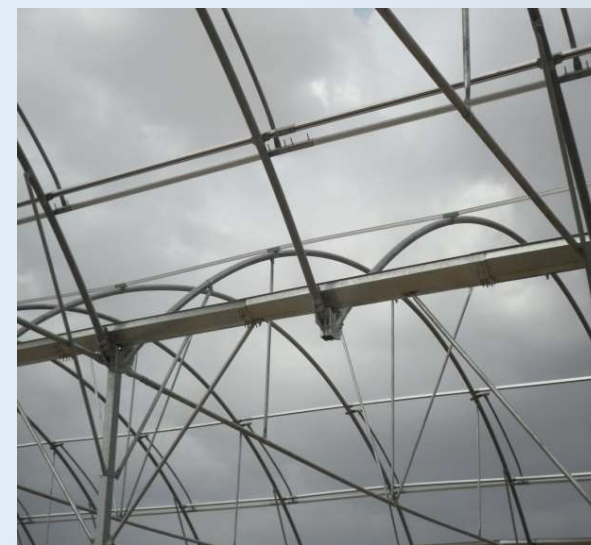
• طرح آریا